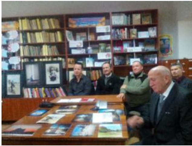
Фото Засідання літературної вітальні в Малоданилівській бібліотеці. У Вільшанській бібліотеці-філії №14 для дорослих діє Клуб любителів поезії та поетів-початківців «Пегас».