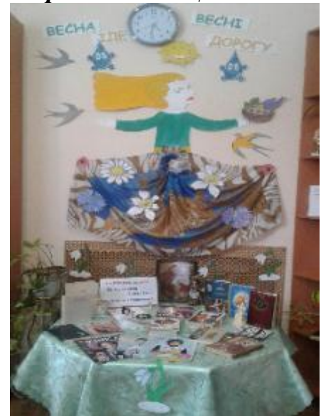
Фото Виставка в Токарівській бібліотеці