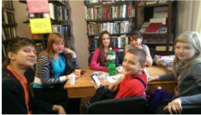
Фото Година-порада «Культура користування мобільним зв'язком»

В Солоницівській бібліотеці пройшло засідання клубу «Пізнайко» під назвою «Культура користування мобільним зв'язком» в формі години-поради. Метою заняття було формувати й розвивати в учнів уміння користуватися мобільним телефоном у громадських місцях, транспорті тощо; визначити рівень і стан існуючої культури учнів користування мобільним зв'язком під час навчання у школі.