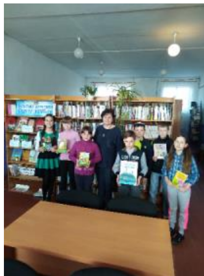
Фото Бібліотечний урок «Книга – жива пам'ять поколінь»

Бібліотечні уроки, як форма популяризації бібліотечно-бібліографічних знань, допомагають у формуванні інформаційної культури та урізноманітнюють тематику виховних заходів. Бібліотечний урок «Книга – жива пам'ять поколінь» Шовкоплясівської бібліотеки пройшов в ігровій формі. Головною метою було допомогти дітям по-новому зрозуміти окремі поняття, запам'ятати певні моральні правила поведінки з книгою. Урок пройшов для учнів Дергачівського ліцею №1.