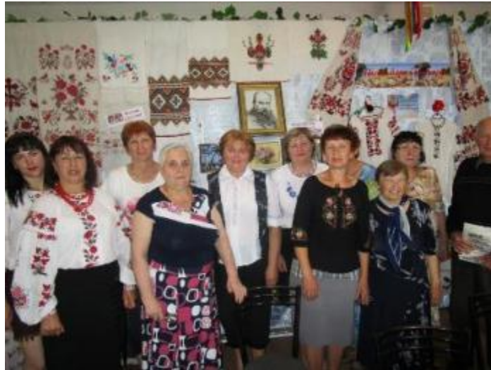
Фото Засідання клубу «Розрада» в ЦБ

Лебеденко. Завдяки експозиції «Рукотворне диво читачів», присутні мали змогу ознайомитись із сучасними та старовинними зразками вишивок.