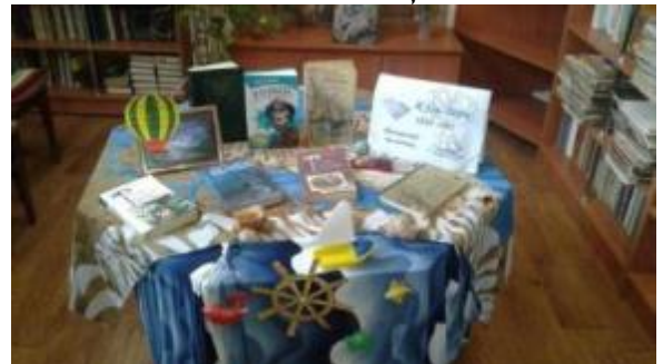
Фото Виставка в Токарівській бібліотеці