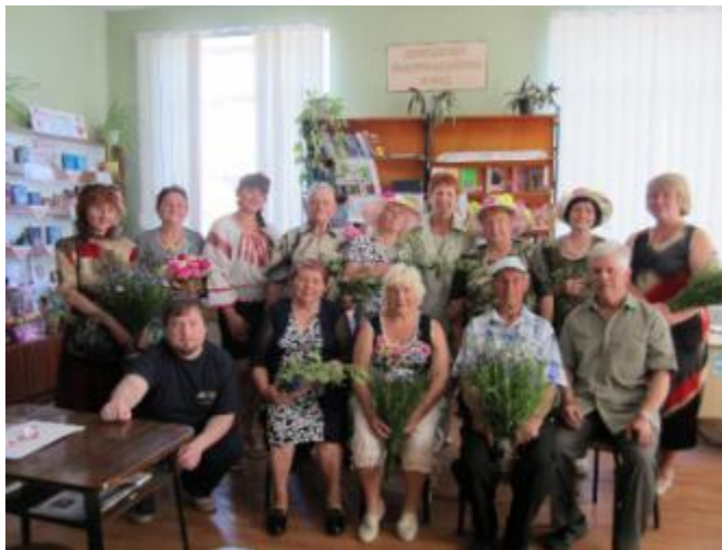
Фото Засідання клубу любителів поезії і аматорів-початківців «Пегас», присвячене Зеленій неділі

Фото Засідання літературної вітальні в Малоданилівській бібліотеці. У Вільшанській бібліотеці-філії №14 для дорослих діє Клуб любителів поезії та поетів-початківців «Пегас».