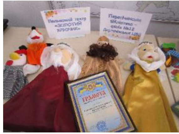
Фото Пересічанська бібліотека на Бібліофесті

- Проект Громадської Організації «Широкий степ» «Зміцнення партнерства між поліцією та громадою через Інститут третього віку» впроваджено в Русько-Лозівській громаді Дергачівського району Харківської області з загальною чисельністю населення 5018 осіб, і його діяльність буде поширена на весь район. Громадська організація «Широкий степ» впроваджує цей проект за фінансування Європейського союзу.