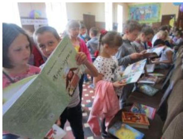
Фото Бібліотечне містечко в Пересічанській бібліотеці-філії

Роблячи зупинки біля кожної з них, разом із дітьми провели вікторини по казках, відгадували загадки, пограли у літературну гру «Чи уважний ти читач?», провели конкурси «Кіт у мішку», «Якому герою належить ця річ?», «Намалюй героя казки». Діти залюбки брали участь у розвагах.