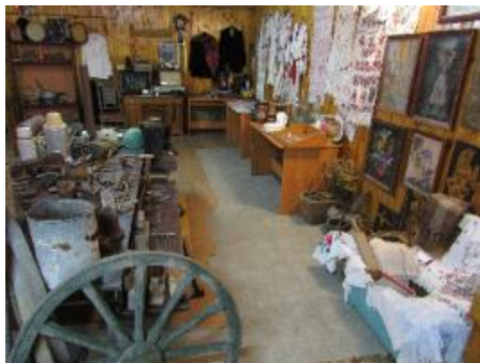
Фото В Черкаськолозівському музеї

Черкаськолозівська бібліотека-філія №20 (завідувач Домніч О.М.) продовжує працювати з краєзнавчим музеєм.