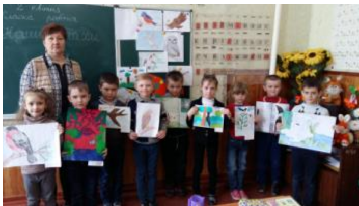
Фото Бесіда «У світі пернатих»

Цупівська бібліотека-філія №4 провела бесіду «У світі пернатих» для учнів молодших класів Цупівського НВК. Бібліотека запросила дітей на конкурс пташиної краси.