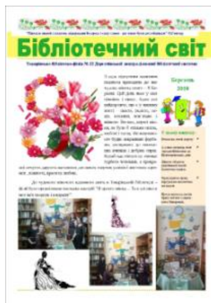
Фото 1-ша сторінка газети «Бібліотечний світ»

Вільшанська дитяча бібліотека №15 веде Книгу відгуків і пропозицій, Слатинська – Магічну книгу прийому та здійснення побажань та пропозицій. В ЦБ користувачі ведуть зошит читацьких історій «Як я зустрів улюблену книгу», Солоницівська бібліотека провела акцію «Відпусти улюблену книгу у подорож», Токарівська бібліотека-філія №22 випускає газету «Бібліотечний світ».