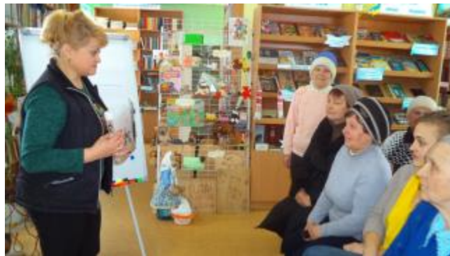
Фото Презентація книги "Тут здавна люди сонце несли..."

Руськоколівська бібліотека організовує дозвілля жителів села (клуб за інтересами «Дозвілля»). Учасники клубу займаються вишивкою, бісероплетінням та запрошують на засідання талановитих земляків. Кожен рік підводять підсумки «Бібліотека презентує таланти»