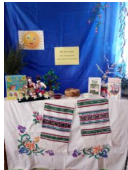
Фото Масляна в Дворічнокутянській бібліотеці