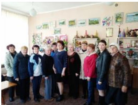
Фото Літературний вечір по творчості Ліни Костенко

Активно працює з Територіальним центром соціального обслуговування Дергачівського району Шовкоплясівська бібліотека-філія №19, відвідує підопічних терцентру з пізнавальною інформацією, проводить заходи. Чергове засідання клубу «Берегиня» Шовкоплясівської бібліотеки пройшло 20 квітня в Дергачівському територіальному центрі. Це був літературний вечір, присвячений творчості Ліни Костенко. Учасники отримали велике задоволення від спілкування з однодумцями.