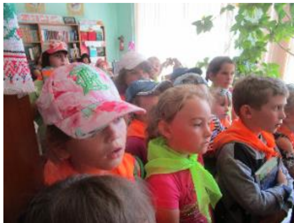
Фото В Козачолопанській бібліотеці вихованці літнього табору.

До Козачолопанської бібліотеки завітали першокласники. Діти ознайомились з бібліотекою та переглянули казки лялькового театру «Казка».