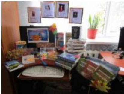
Фото Виставка до Дня знань в ЦБ