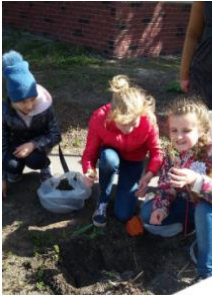
Фото Екологічний марафон

пробудити в них небайдуже ставлення до навколишньої природи, долучити їх до читання літератури з екологічної тематики. Було проведено акцію «Здай батарейку – врятуй їжака», висаджено маленькі саджанці сосонок навколо бібліотеки. Оформлено виставку та проведено годину пам'яті «Герновий вінок Чорнобиля».