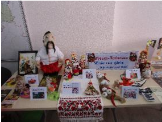
Фото Русько-Лозівська бібліотека на Бібліофесті

- Русько-Лозівська бібліотека-філія №21 та Пересічанська бібліотека-філія 12 брали участь у Бібліофесті «Бібліотека+», що організувала ХОУНБ