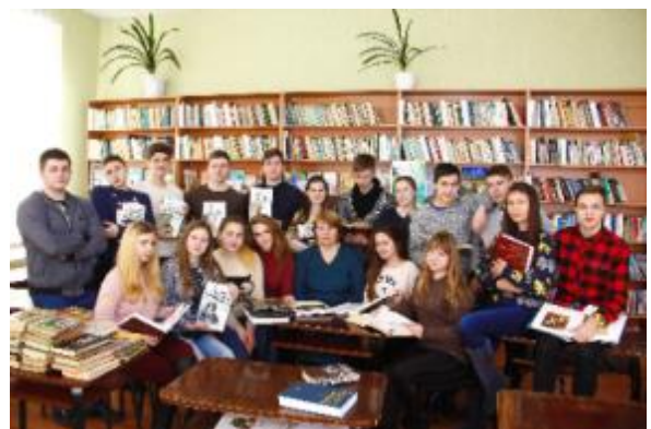
Фото Фотосесія у Вільшанській бібліотеці для дорослих

Бібліотеки системи охоплюють різні напрямки роботи. До Дня довкілля, Всесвітнього дня Землі, Дня Чорнобильської трагедії Дергачівська центральна та Центральна дитяча провели екологічний марафон. Учасниками марафону були учні шкіл, діти дошкільних закладів міста. Працівники бібліотек намагаються