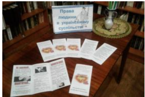
Фото Буклети Токарівської бібліотеки

Бібліотечні уроки, як форма популяризації бібліотечно-бібліографічних знань, допомагають у формуванні інформаційної культури та урізноманітнюють тематику виховних заходів. Бібліотечний урок «Книга – жива пам'ять поколінь» Шовкоплясівської бібліотеки пройшов в ігровій формі. Головною метою було допомогти дітям по-новому зрозуміти окремі поняття, запам'ятати певні моральні правила поведінки з книгою. Урок пройшов для учнів Дергачівського ліцею №1.