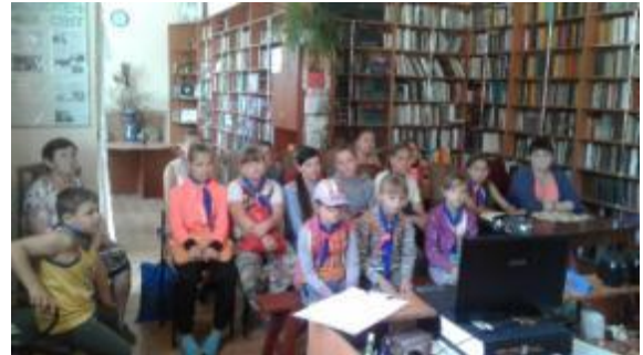
Фото Віртуальна подорож «Казкова мандрівка країнами Європи». Токарівська бібліотека

Впродовж року здійснюється довідково-інформаційне і бібліографічне обслуговування фахівців районної ради та місцевого самоврядування, медицини, освіти, культури.