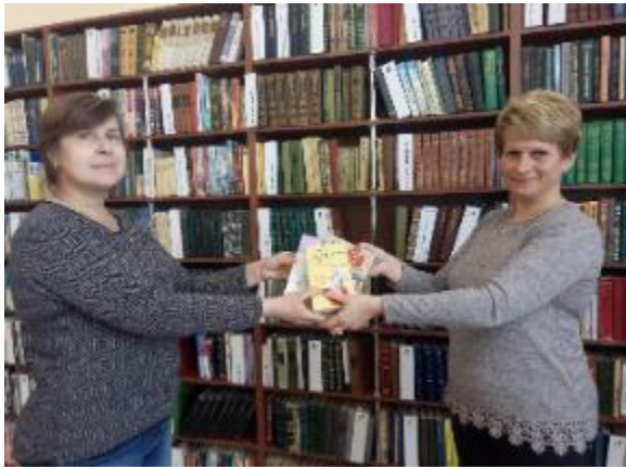
Фото Свято книгодарування у Великопроходівській бібліотеці