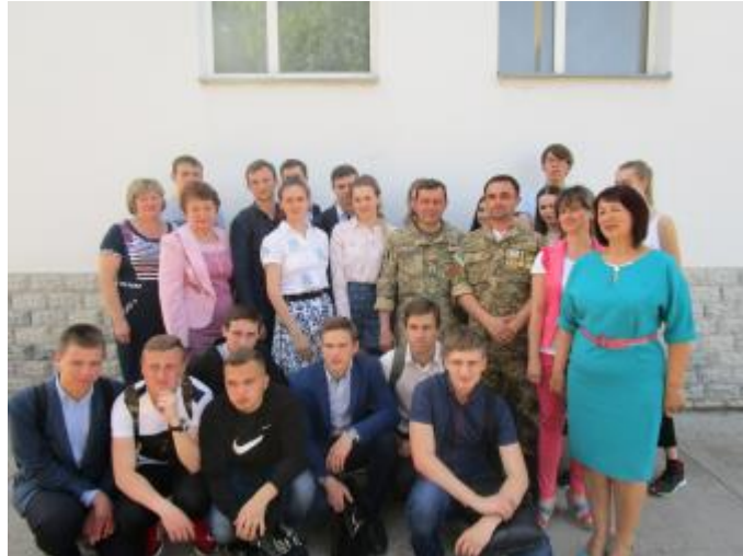
Фото Зустріч з учасниками АТО в ЦБ

мовчання вшанували пам'ять загиблих земляків-дергачівців, портрети яких виставлені в читальній залі бібліотеки. В літературно-музичній композиції, підготовленій працівниками бібліотеки, прозвучали зворушливі вірші та пісні про героїзм сучасних захисників України. Також присутні ознайомились з книжковою виставкою «Герої живуть поряд» та прослухали бібліографічний огляд видань, представлених на виставці.