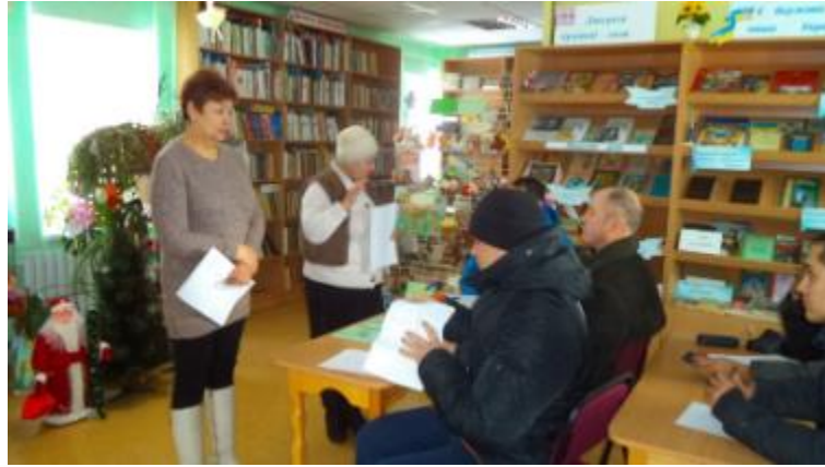
Фото Консультації учасникам АТО В Русько-Лозівській бібліотеці.