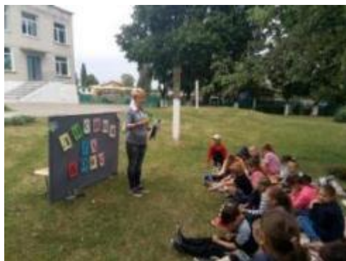
Фото Бібліопікнік «Читаємо під парасолькою».