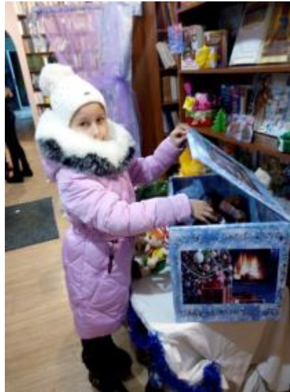
Фото Акція в центральній дитячій бібліотеці

«Подаруй бібліотеці книгу», «Відпусти улюблену книгу у подорож», «Зігрій теплом і любов'ю дитячі серця». Діти-користувачі центральної дитячої бібліотеки приносили подарунки для дітей, що залишилися без батьківського піклування.