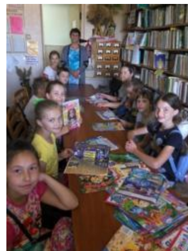
Фото Екскурсія до Черкасько-Лозівської бібліотеки

Також проводились посвяти в читачі, конкурс на краще фото читача з книгою «Я – читаю», бібліотечні тусовки, школи знань.