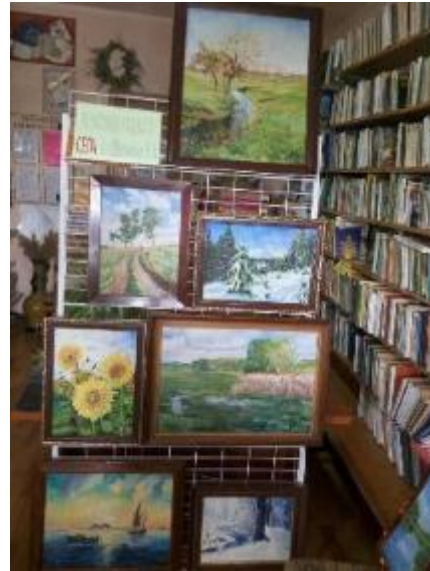
Фото Виставка картин в Черкасько-Лозівській бібліотеці