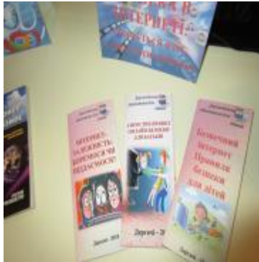
Фото Буклети ЦБ дитячої

Складено буклети «Мій улюблений світ без насильства» (Токарівська бібліотека), «Шануймо рідне, серцем закликаю...»( до 100-річчя Д.Бакуменка») ЦБ, «Інтернет-залежність. Боїмося чи піддаємося?», «5 простих правил онлайн-безпеки для батьків», «Безпечний Інтернет. Правила безпеки для дітей» – дитяча ЦБ.