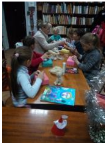
Фото Заняття гуртка «Умілі руки»

Для популяризації книги використовували такі форми роботи, як відео-екскурси, бібліо-пікніки, дитячі Містечка, посиденьки, добродійні акції (напиши листа солдату), солодкі мікрофони, вело-мандрівки, яблучний фуршет, гурман-вечір, книжкове дефіле, літературний турнір знавців природи, літературний мікс, бульвар бібліотечний, буккросинг, лібмоб, галявина цікавого, велнес-шоу від одного бібліотекаря та ін. Організуються виставки робіт користувачів бібліотек («Диво власними руками», колекція саморобок «Чудо леса») майстер-клас з оригамі (Ветеринарна бібліотека). В Малоданилівській бібліотеці проводяться заняття гуртка «Умілі руки». На цих заняттях шиються іграшки, своїми руками діти роблять цікаві поробки з різних матеріалів.