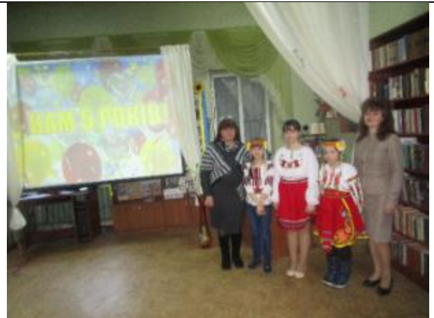
Фото Учасники творчого об'єднання «Літературне мереживо» на засіданні, присвяченому п'ятирічному ювілею