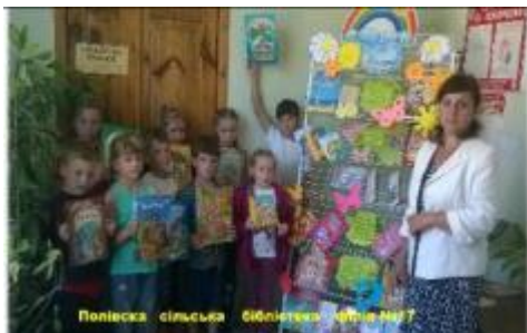
Фото Екскурсія до Полівської бібліотеки

З метою залучення учнів до читання, навчити їх користуватися бібліотекою книгозбірні Дергачівської ЦБС організовують екскурсії «Перший крок до бібліотеки».