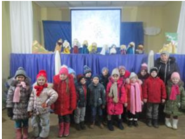
Фото Актори театру «Золотий ключик». Різдвяний вертеп

Дитячий ляльковий театр «Золотий ключик» діє при Пересічанській бібліотеці-філії №12 з січня 2014 року.