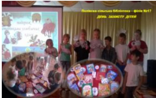
Фото Літо в Полівській бібліотеці

Полівська сільська бібліотека-філія №17 підготувала цикл заходів для вихованців літнього табору Полівського НВК. Це виставка-настрій «Літо, сонце, позитив», літературно-розважальна гра «З книгою канікули, сумувати ніколи», хіт-парад кращих книжок «Немає кращої пори, ніж літо сонячне й веселе», кросворди для дітей «Прочитай-відгадай». Діти із задоволенням беруть участь у цих заходах.