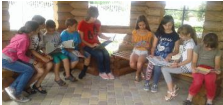
Фото Літня альтанка.

Захід пройшов цікаво як для дітей, так і для бібліотекаря, оскільки мета бібліотеки – показати дітям, що бібліотека не тільки «дім» книг, але й територія захоплюючих і веселих «подорожей».