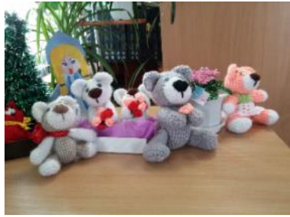
Фото Виставка поробок користувачів Руськолозівської бібліотеки