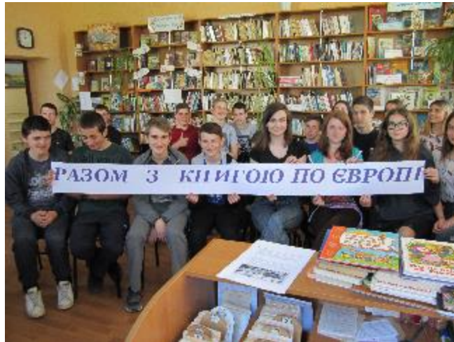
Фото Віртуальна подорож країнами Європи

Європи, порівняти та проаналізувати цю інформацію, Вільшанські бібліотеки для дітей та дорослих підготували для учнів 9-х класів Вільшанської ЗОШ цікаву програму «Під стягом Європи». Вона поєднала в собі віртуальну подорож країнами Європи, вікторину і інформаційну годину.