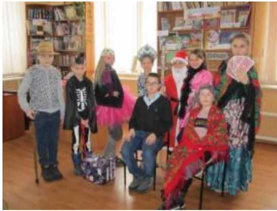
Фото Вистава «Незвичайна зимова пригода».

Руськоколівська бібліотека організовує дозвілля жителів села (клуб за інтересами «Дозвілля»). Учасники клубу займаються вишивкою, бісероплетінням та запрошують на засідання талановитих земляків. Кожен рік підводять підсумки «Бібліотека презентує таланти»