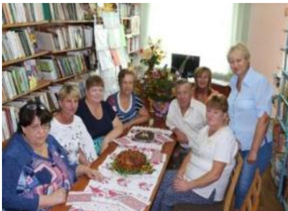
Фото Магічний коровай в Черкасько-Лозівській бібліотеці

Проводяться години, уроки народознавства. В бібліотеках постійно діють виставки предметів старожитностей, вишивки . Бібліотеки беруть активну участь в фольклорних святах – Купальський калейдоскоп «Магічне слово Івана Купала» (Григорівська, Протопопівська, Слатинська, Прудянська, Дворічнокутянська, Черкасько-Лозівська), фестивалях, естафетах культури, козацьких турнірах. Святкуються Різдво, Зелена неділя, Масляна, Великдень, день Святого Миколая та ін.