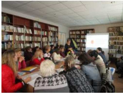
Фото Бесіда спеціаліста - офтальмолога в ЦБ

Дворічнокутянська бібліотека-філія №13 Дергачівської ЦБС співпрацює з Недільною школою, сільською радою, ліцеєм, Григорівським та Полівським сільськими клубами. В 2018 році взяла участь у II фестивалі української творчості «Це моя земля! Це моя країна!». Учасники фестивалю - працівники бюджетних організацій та установ Полівської ради.