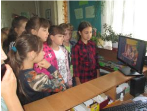
Фото Поетичний флешмоб «Вклоняємось твоїй красі, природо!»

Дворічнокутянська бібліотека-філія №13 провела поетичний флешмоб. Учасниками флешмобу були вихованці пришкільного табору Дворічнокутянської ЗОШ «Рожева мрія» (директор Руденко Н.І.). Дітлахи із загонів «Смішарики» та «Працьовиті» ознайомились з книжковими виставками «Дивосвіт природи» та «У відпустку з книгою». Їм сподобались відео «Життя птахів у природі» та мультфільм на вірш Т.Г. Шевченка «Садок вишневий коло хати».