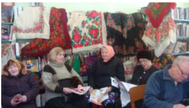
Фото Виставка хусток в Ліснянській бібліотеці