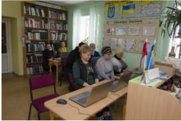
Фото Заняття комп'ютерного класу «Університету третього віку»

віку, в основі якого використовується методика театральної сценічної дії і зворотній зв'язок з аудиторією. В рамках форум-театру було розіграно 3 сцени: зняття готівки з банківської карти, вимога викупу по телефону, знайомство в Інтернеті, яке передбачує перерахування грошей. У кожного учасника тренінгу склалася певна модель поведінки у цих ситуаціях і вони знають, які питання потрібно задавати шахраям для руйнування їх схем лиходійства.