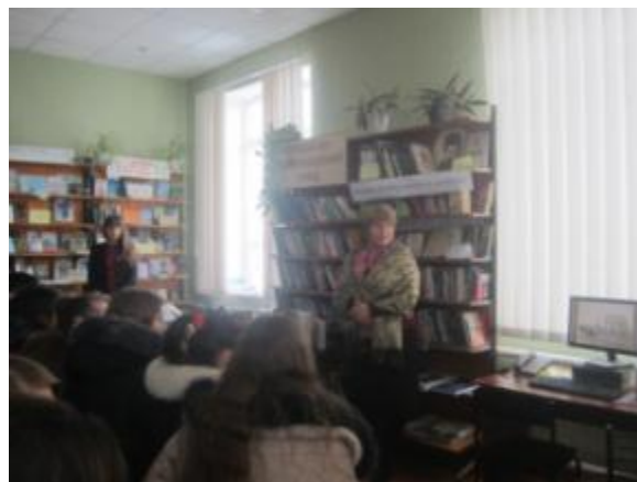
Фото Відео-експерс «Скульптури, що випромінюють світло»

Вільшанська бібліотека для дорослих знайомить користувачів не тільки з визначними куточками рідного краю, а й з іншими місцями країни та зарубіжжя. Так, завідувач бібліотеки І.Д. Тризна підготувала надзвичайно цікавий експерс «Скульптури, що випромінюють світло». У кожній країні є багато старовинних і сучасних пам'яток, які щорічно залучають мільйони туристів. Крім замків, площ, палаців і парків, ще є найцікавіші статуї кохання. Презентовано пам'ятники та скульптури, які просто необхідно «знати в обличчя». Пам'ятник закоханим у Харкові, «Закохані ліхтарі» у Києві, Пам'ятник вічного кохання у Києві, Україна; Парк Love Island; острів Чеджу, Південна Корея; «Кохання» Батумі, Грузія.