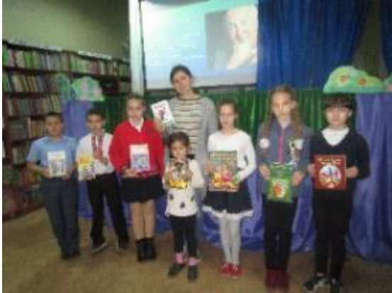
Фото Віртуальна мандрівка «До німецьких письменників на гостину»

Е. Распе, а також відкривали для себе нові імена та нові книжки. Це «Нескінченна історія», «Момо» М. Енде, «Володар над злодіями» та «Іграйна Безстрашна» Корнелії Функе та ін. Переглядаючи презентацію, присутні на заході мали змогу розширити свої знання та ближче познайомитися з творчістю німецьких письменників.