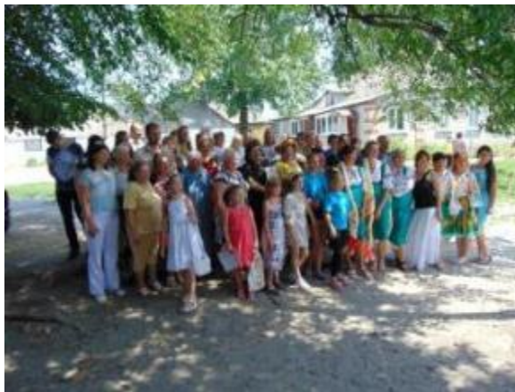
Фото Учасники фестивалю

Дворічнокутянська бібліотека-філія №13 Дергачівської ЦБС співпрацює з Недільною школою, сільською радою, ліцеєм, Григорівським та Полівським сільськими клубами. В 2018 році взяла участь у II фестивалі української творчості «Це моя земля! Це моя країна!». Учасники фестивалю - працівники бюджетних організацій та установ Полівської ради.