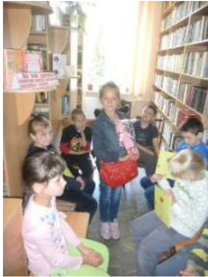
Фото Вгадай ім'я ляльки. Безруківська бібліотека