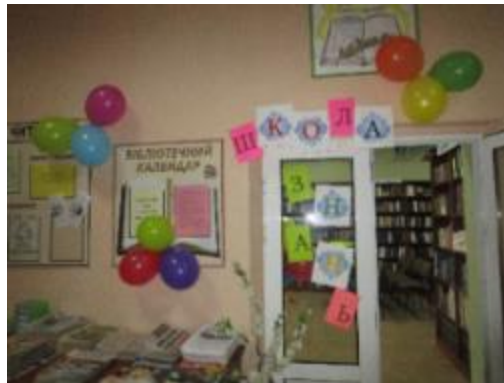
Фото Школа знань в Пересічанській бібліотеці

Діти із задоволенням подивились пізнавальний ролик про мову, відповідали на запитанні вікторини, приймали участь у «Граматичному аукціоні».