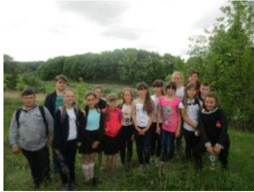
Фото Експерсія в заповідник

складає 5,6 га. Заказник знаходиться біля села Ветеринарне Козачолопанської селищної ради. Діти передивились, чи є опізнавальні знаки заказника та передали інформацію в селищну раду.