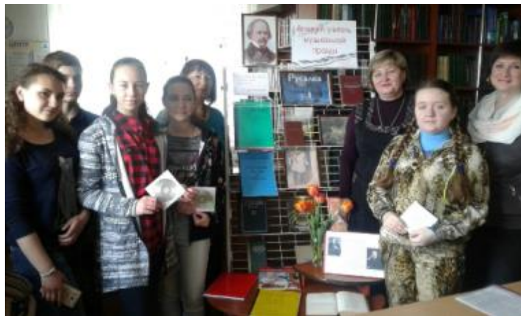
Фото Засідання, присвячене шедевр О.Даргомижського опері «Русалка»

В Центральній бібліотеці діє і літературно-музична вітальня «Слово і музика». Головним завданням діяльності вітальні є залучення до читання якомога більшої кількості читачів, особливо молоді, а також розвиток їх творчих здібностей.