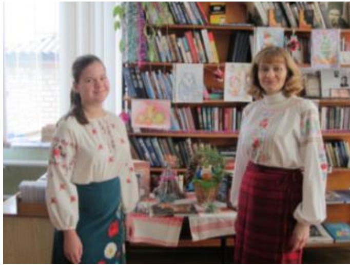
Фото Мереживо зимових свят у Вільшанській бібліотеці для дорослих