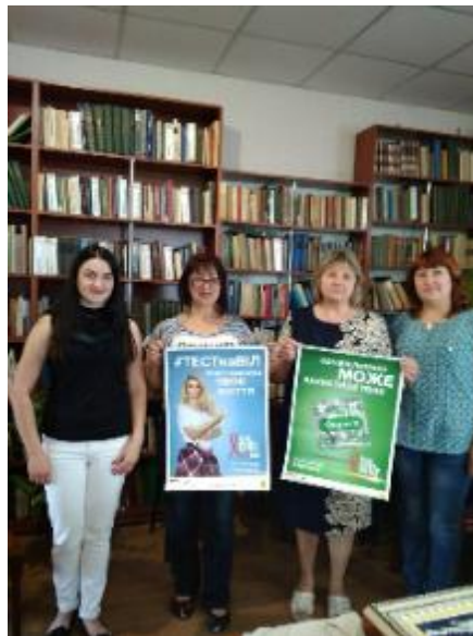
Фото Година спілкування в ЦБ

Годину спілкування «Живи як треба, і лікаря не треба» до Всесвітнього дня пам'яті людей, які померли від СНІДу та до Всесвітнього Дня боротьби з тютюнопалінням провели працівники ЦБ та Районного центру соціальних служб для сім'ї, дітей та молоді.