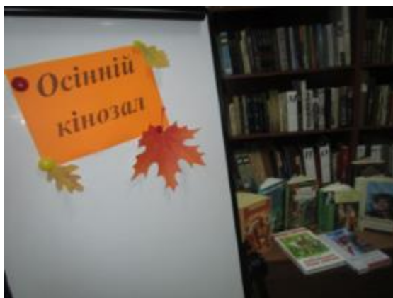
Фото Осінній кінозал Пересічанської бібліотеки